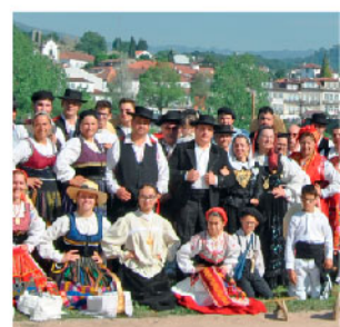
XXXVII FESTIVAL DE FOLCLORE DO GRUPO DE DANÇAS E CANTARES DE PONTE DE LIMA